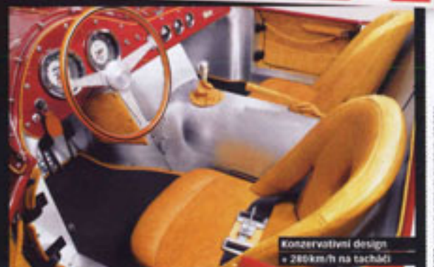
Konzervativní design • 280km/h na tachétě