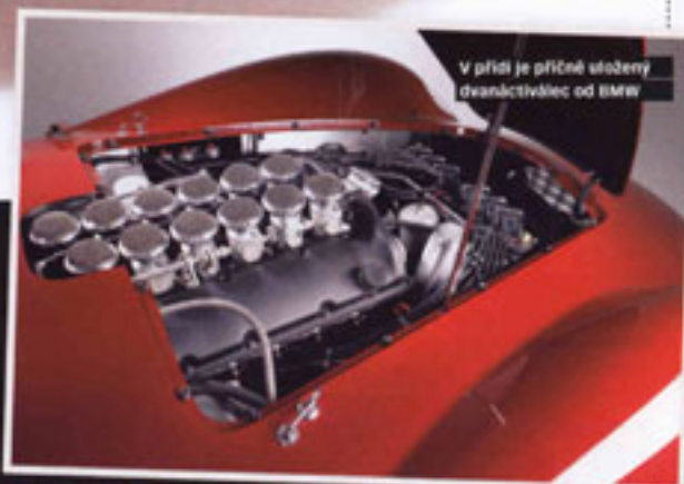
V přídi je příčně složený dvanáctiválec od BMW

Smithovi se vyřádili i na doplňcích. Přístroje nesou značku Veglia, volant Nardi, světlá Marchal a Carello, přepínače Magneti Marelli a kompletní kola, uchycená centrální maticí, byla vytvořena v továrně Borrani. Vozy se vyrábějí ručně, a to ze surových materiálů od krytů světel až po hlavici řadicí páky. Interiér nabízí dostatek komfortu i při použití dnešních měřtek: v kokpitu si hovíte na stavitelných sedadlech čalouněných italskou rukavičkářskou kůží, rolexy si můžete odložit do kapsy ve dveřích, a až vám bude zima, pustíte si topení. O vaši bezpečnost se postará zvláštní rám a tankování vám usnadní nalévací hrdlo nádrže vyrobené pro rychlé plnění paliva velkým průtokem. Vířka je na nápravu rozložena v poměru 45:55, tedy téměř ideálně. Pokud milujete vozy z dob minulých, na cenu se neptejte. Není podstatná. Buďte auto berete, nebo se jděte zeptat do „žček“.